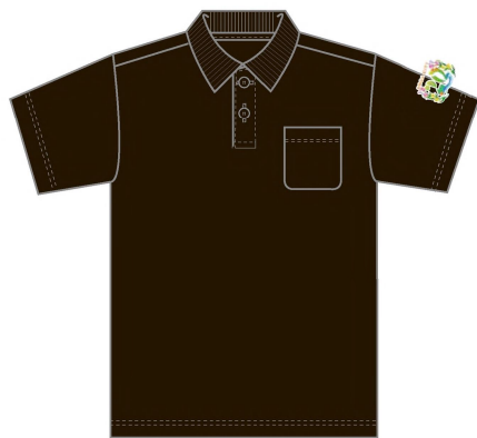
ブラック 005 ●