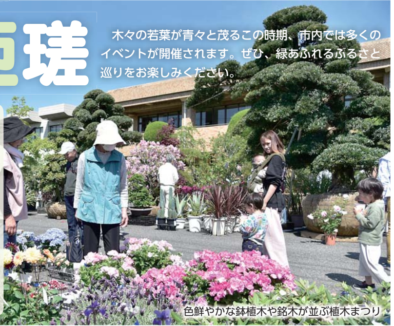
色鮮やかな鉢植木や銘木が並ぶ植木まつり