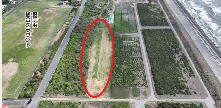
植樹場所は野手浜総合グラウンド南側(写真:赤マルが植樹箇所)

5月24日(日)野手浜総合グラウンド南側防潮堤で、植樹祭を実施します。当日はキッチンカーによる出店もあります。市民の皆さんの参加をお待ちしています。