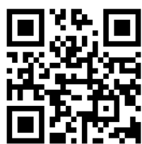
つうえんポータル 利用申請画面

給付認定に係る申請書類やキャンセルポリシーについては、ホームページに掲載されておりますので、制度の利用を検討されている方やこれから利用申請をされる方は是非ご覧ください。