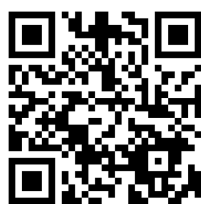
つうえんポータル ログイン画面