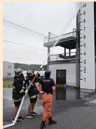
放水体験をする生徒ら(令和5年)