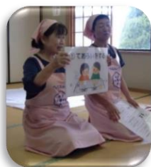
わんぱくクッキングの様子