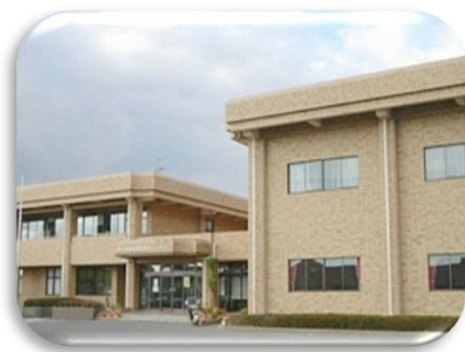
生涯学習センター