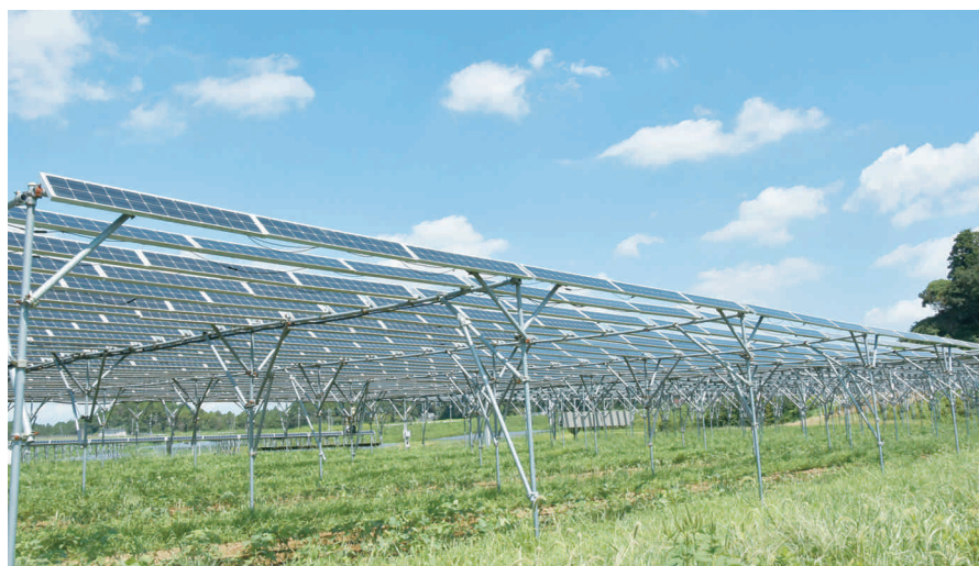
畑でのソーラーシェアリング(営農型太陽光発電)