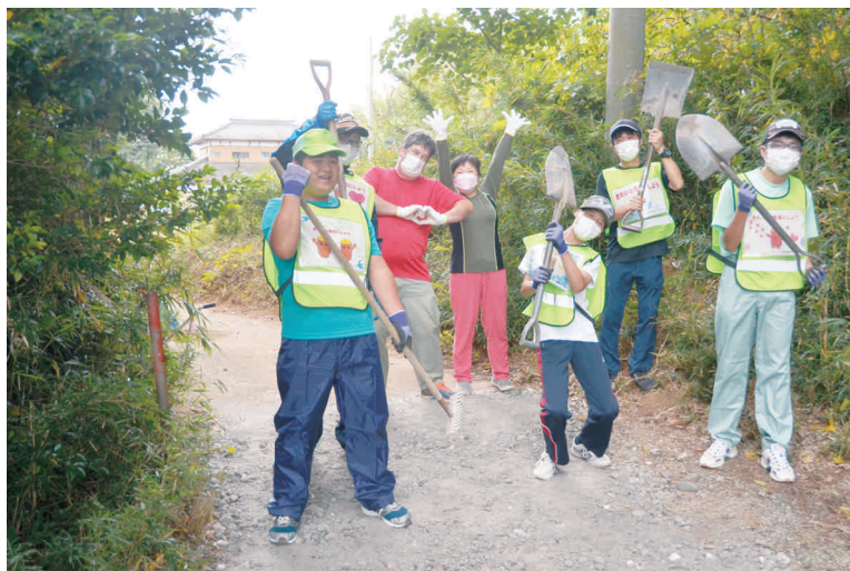
匝瑳市市民提案型事業に採択された県立飯高特別支援学校による活動 (令和4年度)