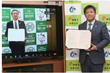
▶関川村の加藤弘村長（左）と宮内市長（締結式はオンラインで開催）