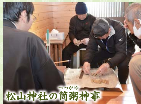
松山神社の筒粥神事

◀青竹に入ったかゆと小豆の分量で吉兆を占う筒粥神事。青竹42本の身を確認し、天候や作物など、今年の縁起を占いました（1月15日）