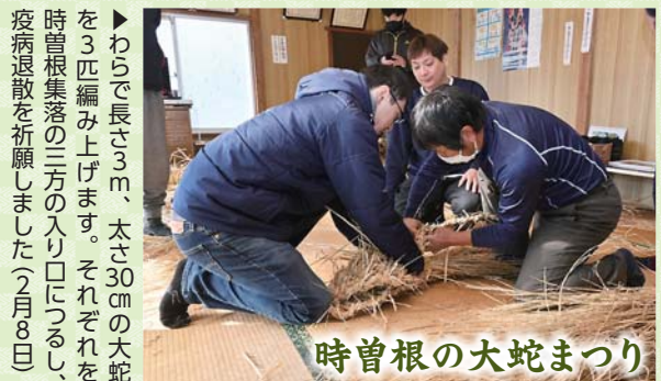
時曾根の大蛇まつり

◀青竹に入ったかゆと小豆の分量で吉兆を占う筒粥神事。青竹42本の身を確認し、天候や作物など、今年の縁起を占いました（1月15日）