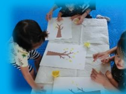
製作・体操・絵本の読み聞かせや 家では体験できない遊びもやるよ！