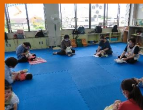
赤ちゃんとのふれあい遊び ママ同士の交流タイム