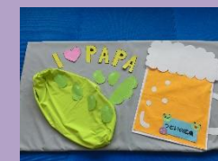
季節をテーマに手形アート・ねぞうアートや 親子ヨガ教室をやっています！

*遊びの会以外にも、毎月の誕生会、季節のイベントなどを行っています。 *毎月の詳しい予定は、匝瑳市ホームページ「つどいの広場」から 見ることができます。