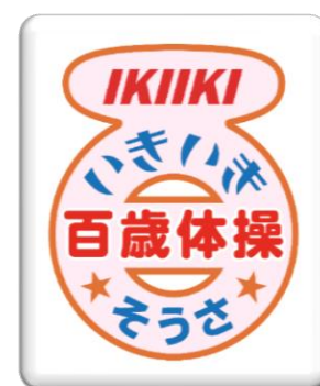
〔いきいき百歳体操ロゴ〕

本事業の歯科衛生士や栄養士と連携し、高齢者が介護予防だけでなく、生活習慣病等の疾病の予防や重症化予防等が図れるように努める。