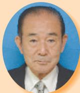
市長 平山 政利