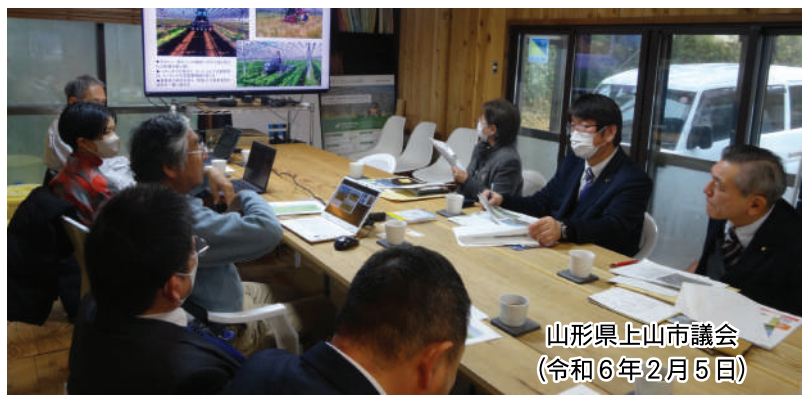
山形県上山市議会 (令和6年2月5日)