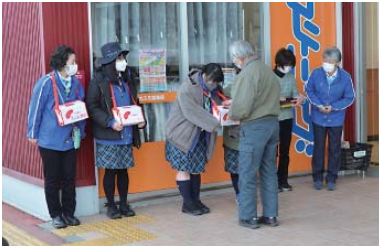
◀商業施設の入り口で声掛けを行うガールスカウト千葉県第98団のメンバーたち