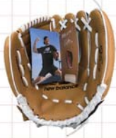
大谷翔平選手より送られたグローブが匝瑳市にも届きました

例えば、大谷翔平選手が使っていた目標達成シートは、ご存じの方も多いと思います。高校時代の監督の教えにより作成したこのシートは、9×9の合計81マスを中心に大きな目標(夢)を置き、周囲に細分化した目標を書き込んだものです。シートを作成する際、なるべく具体的に、また少し高い目標を書き込むようにしたと話しています。一つの大きな目標を達成するために必要な要素を細分化し「かなえたいこと」への道のりを確立したところで、一度に目標達成は難しいですが、そこでより具体性を高めると、目標を見失わずに進めるそうです。皆さまも活用してみたいかがでしょうか。国内全体でスポーツの機運が高まり、選手活躍の期待するとともに新たなヒーローの誕生を楽しみにしたいと思えます。