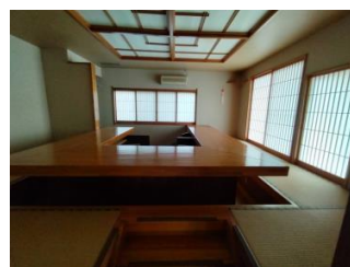
カウンターキッチン