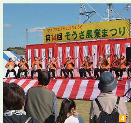
1 会場を沸かす「植木オークション」 2 ブースで地元特産品販売 3 丸太切り競争 4 スコップ三味線演奏