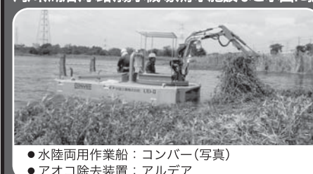
●水陸両用作業船：コンバー(写真) ●アオコ除去装置：アルデア

河川、湖沼、水路、揚水機場、貯水施設など水面に広がる迷惑な水生植物やアオコを除去します。