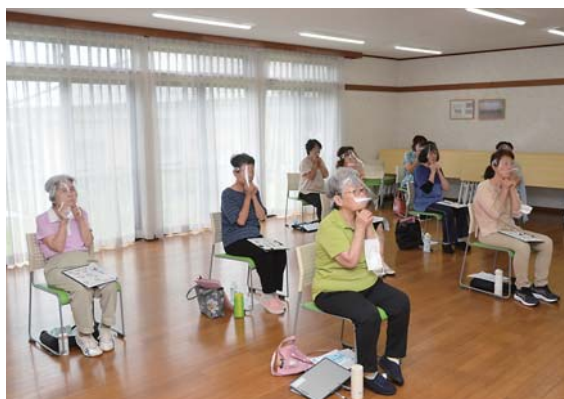
▶かみかみ百歳体操(健口体操)をする参加者