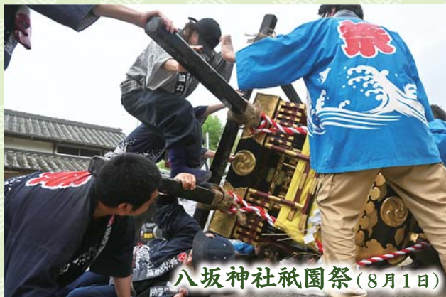
八坂神社祇園祭(8月1日)

中央地区八日市場ハ・箆部田区で7月30日、星宮神社の祭礼が行われました。当日は、夏の日差しが降り注ぐ厳しい暑さの中、神輿が練り出し、大きな掛け声で暑さに負けず威勢よく渡御。1日かけて区内を練り歩きました。