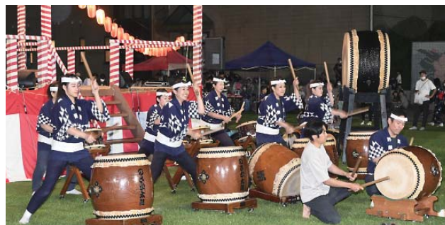
▲観客を魅了したのさか太鼓による演奏

さざんか広場で7月22日、「第28回のおさかふれあい祭り」が開催されました。小学生などによる「子どもみこし渡御」を皮切りに、フラダンスや太鼓演奏などが披露された他、卓球やバスケットボールなどのスポーツ5競技をスタンプラリー形式で回る「スポーツ祭り」も実施され、子どもから高齢者まで多くの人でにぎわいました。