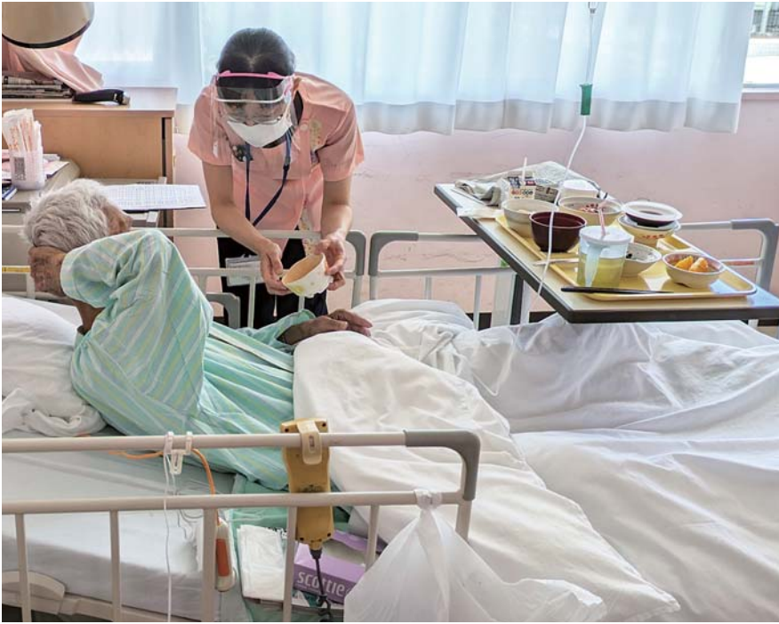
病室への訪問で、患者の食事状況や現在の気持ちなどを確認し、医師、看護師をはじめとする医療スタッフと共有して総合的な治療につなげています

国保匝瑳市民病院では、医師や看護師をはじめ、さまざまな専門スタッフが協力し、それぞれの専門分野から、患者に寄り添い、病状に合わせた処置（医療）を行うことで、総合的に治療を行っています。 今月号では、入院患者への食事提供や外来患者への栄養相談など、栄養科スタッフの取り組みを紹介します。