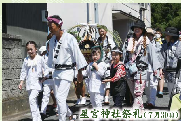
星宮神社祭礼(7月30日)

八重垣神社の境内で7月25日、参拝者が青竹を持ち寄って燃やす駒まねが行われました。これは五穀豊穡、商売繁盛、無病息災を祈願するもので、当日は、青竹を持って参拝する人たちが長蛇の列ができていました。