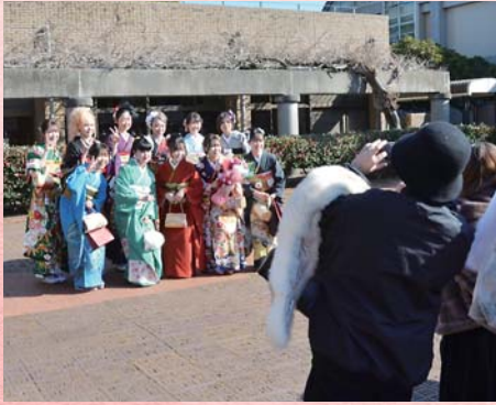
旧友との記念撮影 (同)