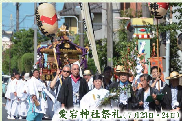
愛宕神社祭礼(7月23日・24日)

栄地区堀川の吉祥院を会場に7月15日、堀川西祇園祭が行われました。当日は、堀川西御囃子保存会が同地区の八坂神社で囃子を奉納した後、演奏しながら区内を巡行。その後の演芸会では、太鼓演奏などが催されました。