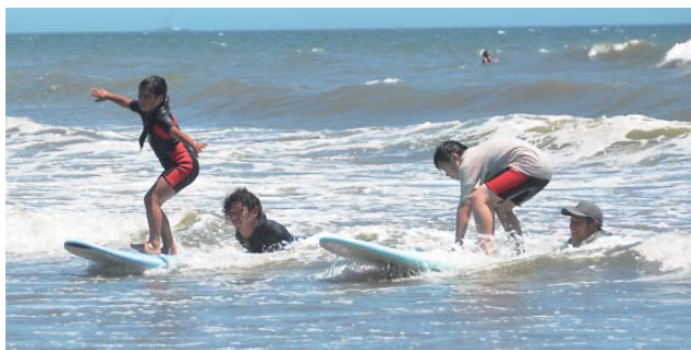
▲マンツーマンでサーフィンを教わる子どもたち