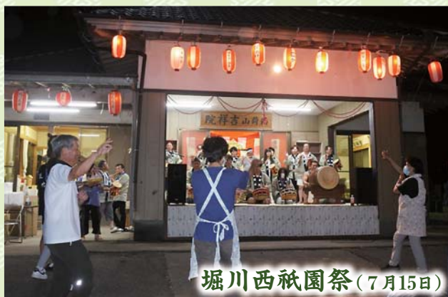
堀川西祇園祭(7月15日)

栄地区堀川の吉祥院を会場に7月15日、堀川西祇園祭が行われました。当日は、堀川西御囃子保存会が同地区の八坂神社で囃子を奉納した後、演奏しながら区内を巡行。その後の演芸会では、太鼓演奏などが催されました。