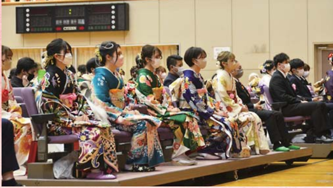
式典に臨む参加者 (令和5年)