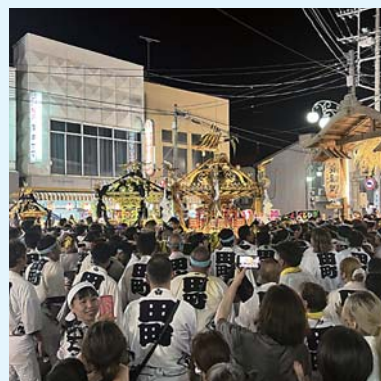
開放した休憩所の前でもまれる神輿

私はこの2日間、祭りを見物される人に向けて、無料休憩所として改装中の店舗を開放しました。町内になじみのある人や今は市外で暮らす匝瑳市出身者など、いろいろな人にご利用いただき