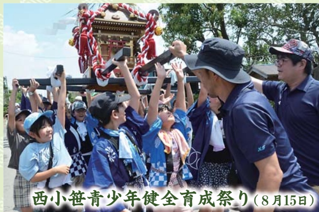
西小笹青少年健全育成祭り(8月15日)

激しく神輿をもみ合う様子から、“けんか神輿”の異名を持つ八坂神社祇園祭が8月1日、平和地区東谷で行われました。激しく神輿をもんだり、神輿を地面に倒したりする場面では、その迫力で一層の熱気を帯びました。