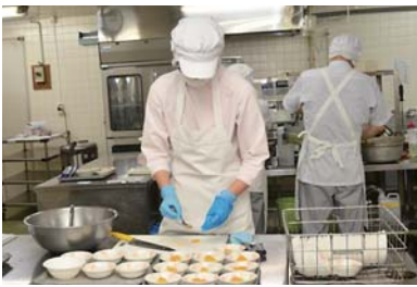
患者の病状に合わせて、柔らかくしたりのみ込みやすくした食事を病院で作っています