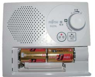
防災行政無線戸別受信機

貸し出し手続きは総務課（市役所2階）で行います。なお、貸し出しは1世帯（市の住民基本台帳に登録されている世帯）に1台です。ただし、