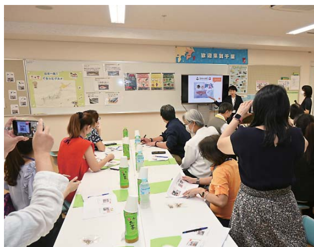
説明を熱心に聞く台南市の教育関係者ら