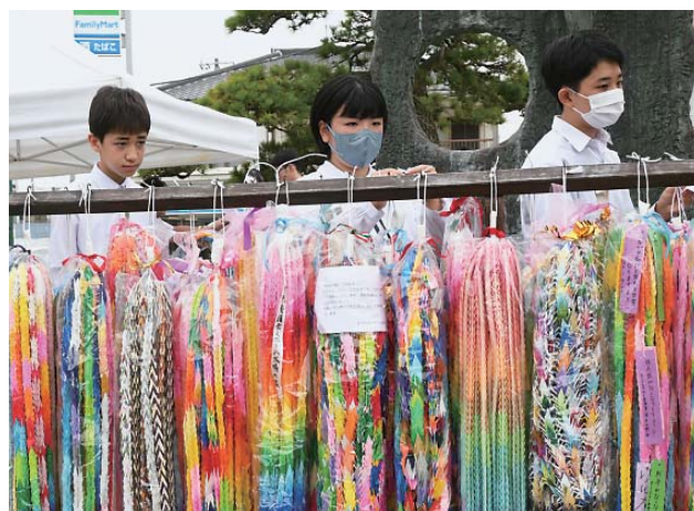
寄せられた千羽鶴をささげる中学生たち

千羽鶴は終戦記念日の8月15日まで飾られた後、広島平和記念公園と長崎原爆資料館に献納されました。