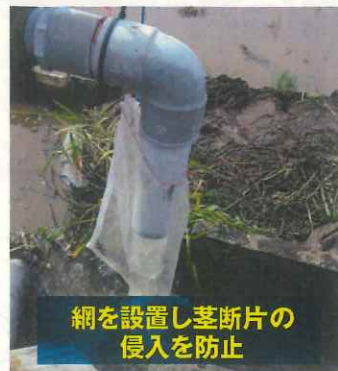
網を設置し茎断片の侵入を防止