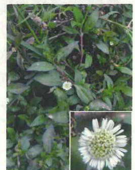
タカサブロウ(在来種)