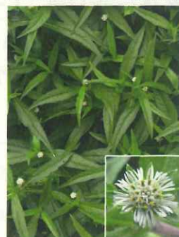
アメリカタカサブロウ(外来種)