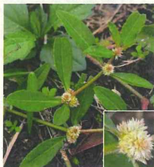
ツルノゲイトウ(外来種)