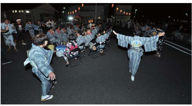
囃子(はやし)の音色に合わせて披露される踊り