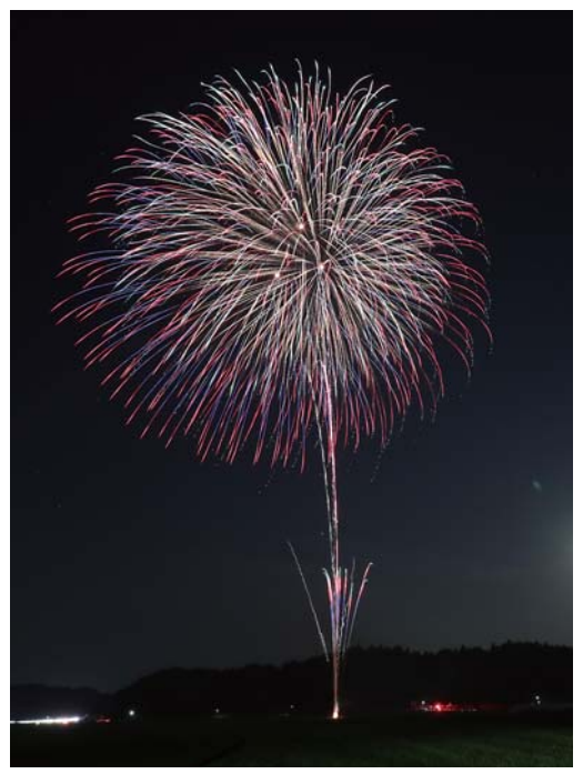
夏の夜空を彩る色鮮やかな花火