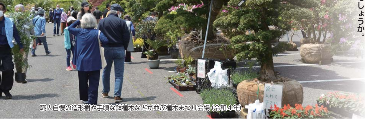
職人自慢の造形樹や手頃な鉢植木などが並ぶ植木まつり会場(令和4年)