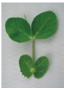
わずかにカップ状 =0.5