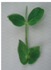
明らかにカップ状 =1