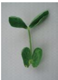
カップ状からさらに変形 =2