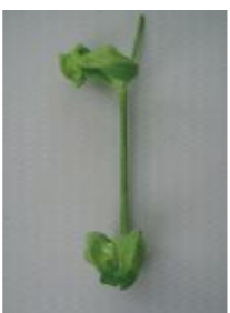
ひどく変形し原型をとどめない =3