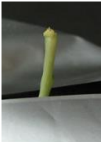
展葉なし（芯止まり） =4