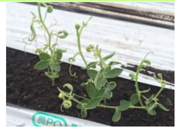
品目: スイートピー 症状: 葉の異常