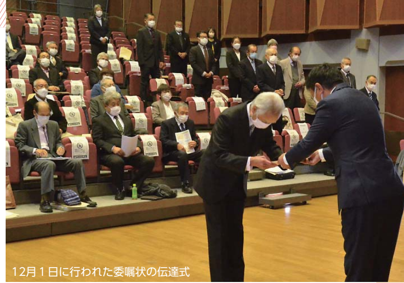
12月1日に行われた委嘱状の伝達式