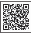
▲チェックサイトはこちら

市では、認知症の行方不明者を早期発見・早期対応できるように、QRコードの付いたシールを配布しています。