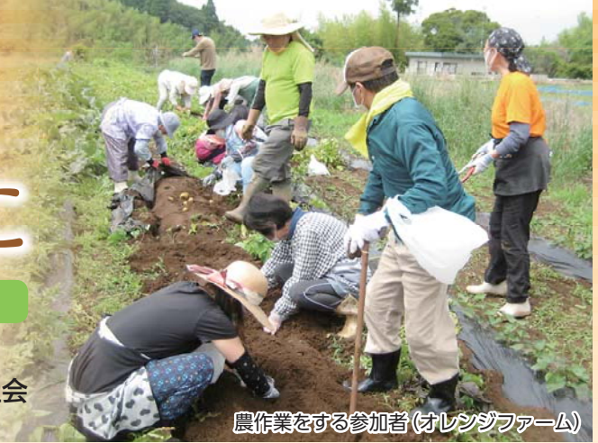
農作業をする参加者(オレンジファーム)

9月は「認知症理解促進月間」です。 認知症の人が尊厳を持ち安心して暮らせる地域社会 の実現のため、認知症の理解を深めてみましょう。