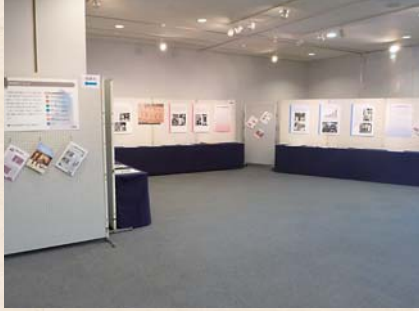
沖縄戦などに関する写真が展示されます

戦争の記憶を次世代に伝える機会として、戦争資料展を開催します。 第二次世界大戦末期の沖縄戦や10代で戦場に動員されたひめゆり学徒隊に関する写真などのパネル資料を展示します。 期間…8月10日(水)〜21日(日) ※15日(月)を除く。 場所…八日市場公民館市民ギャラリー