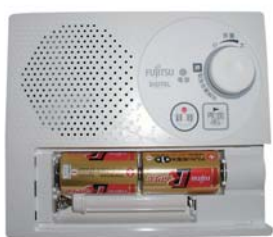
防災行政無線戸別受信機

電池交換のサインが表れたら、一度電源を切り、新しい乾電池と交換し、電源を入れ直してください。 《電池交換のサイン》 ● 電源ランプが赤と緑に交互点滅している。 ● 放送終了後にアラーム音が出る。