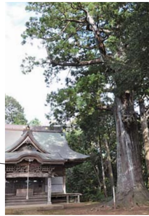
推定樹齢800年以上の大杉がある松山神社