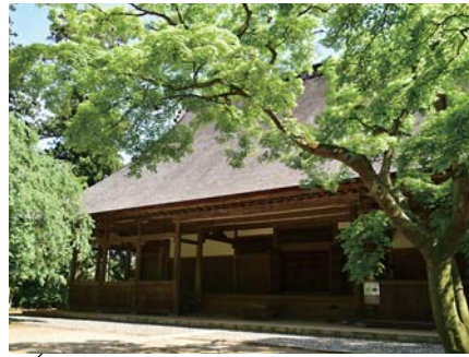
新緑に包まれる飯高寺(飯高檀林跡)