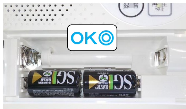
単二乾電池の場合