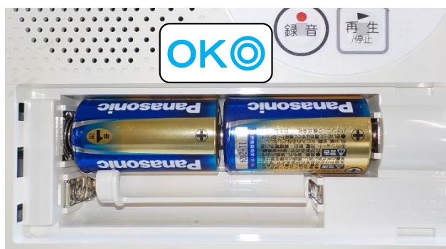
単一乾電池の場合