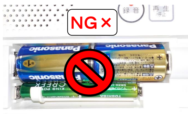
乾電池を4本入れるのはNG