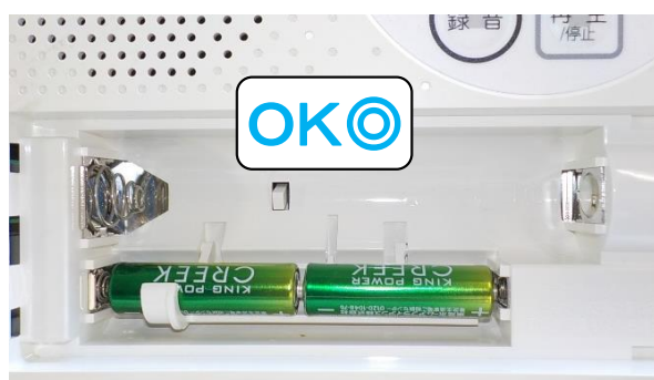
単三乾電池の場合