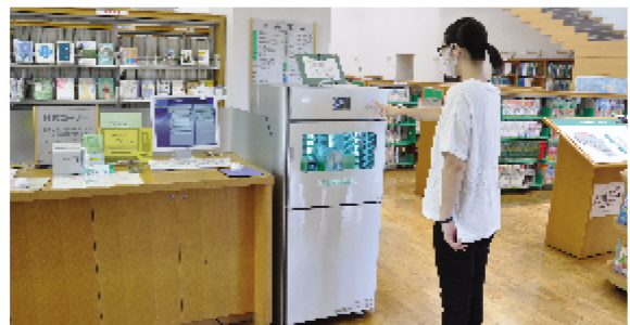
八日市場図書館に設置された図書除菌機