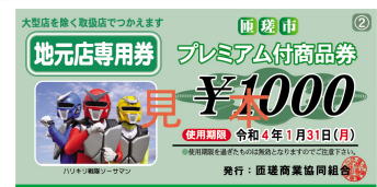
匠瑳市プレミアム付き商品券