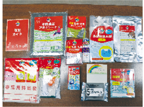
配布予定の防災用品

【進捗状況】対象者への配布が8月中旬から始まり、9月中旬までに対象者全員に配付される予定。