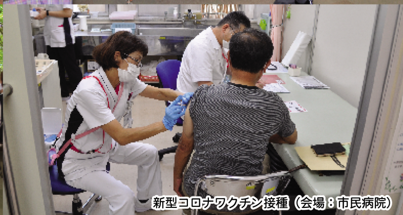
新型コロナウイルスワクチン接種 (会場：市民病院)