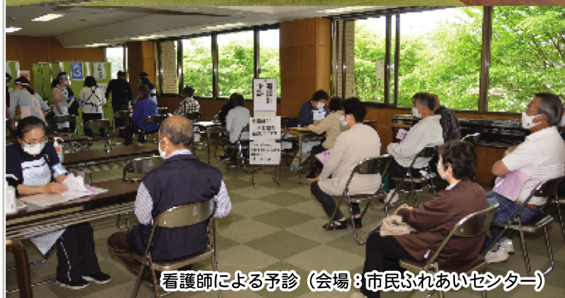
看護師による予診 (会場：市民ふれあいセンター)