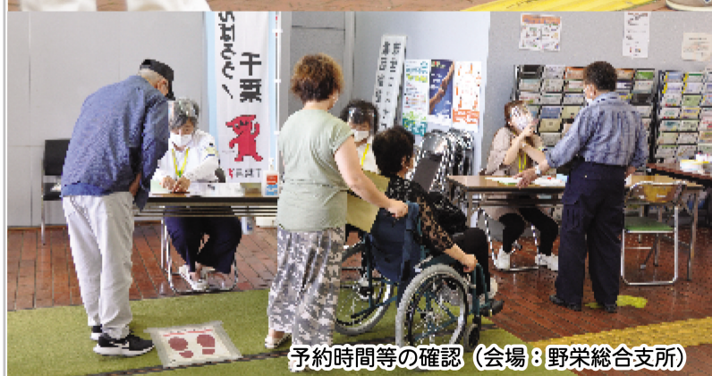
予約時間等の確認 (会場：野栄総合支所)