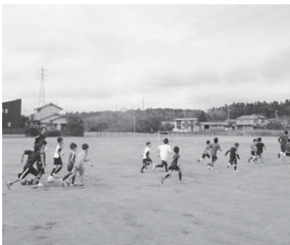
サッカー教室の様子(昨年)