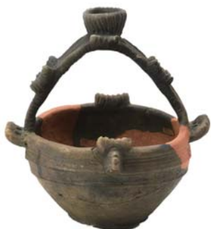
珍しい取っ手付きの土器