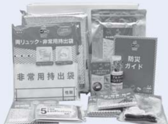
非常用持出袋やLEDライト、アルコールハンドジェルなどを配布