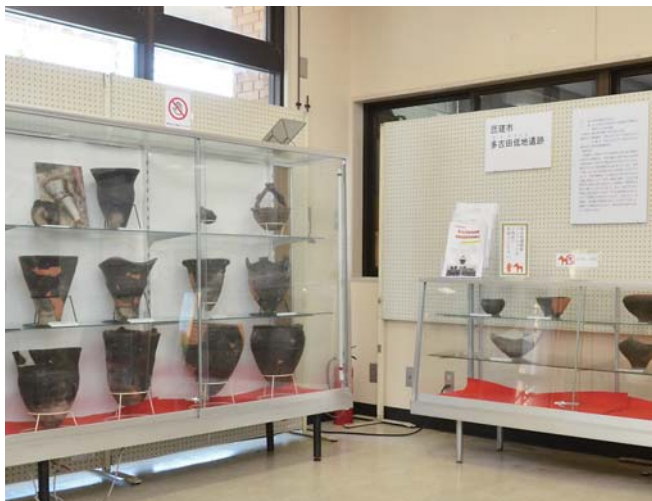
遺跡から発掘した縄文土器19点などを展示

豊和地区飯塚の多古田 低地遺跡で発掘された、 縄文時代の土器や丸木舟 などを展示しています。