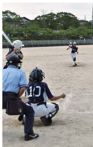
力強いボールを投げる 八日市場第二中の投手