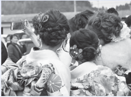
式典に臨む新成人たち(令和2年)