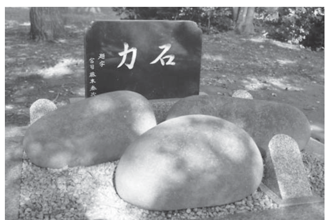
十二所神社の力石

案内板によると、十二所神社の創建は不詳とされるものの765年に京都・賀茂神社の末社としてまつられたのち、1248年(現 在の和歌山県)熊野十二所大明神を合わせまつられたとされます。そして下総国匝瑳南条荘飯倉郷堀川村(川辺、蕪里、堀川小屋、栢田4カ村)の総鎮守であったとされます。市内の力石は、小高(飯