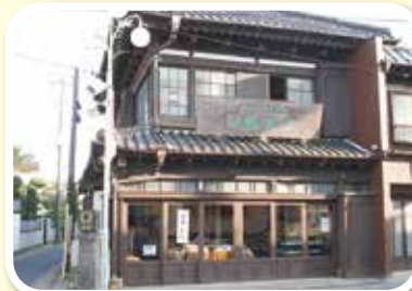
鶴泉堂菓子店店舗兼主屋 鶴泉堂菓子店石倉庫