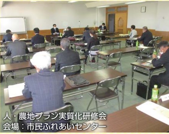
人・農地プラン実質化研修会 会場：市民ふれあいセンター