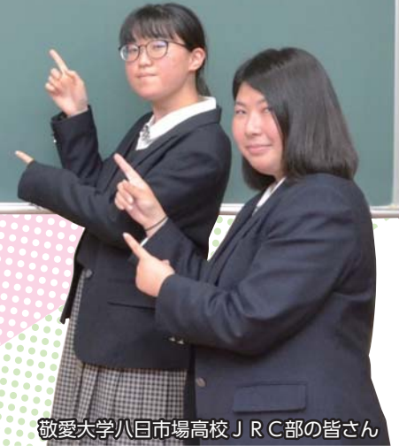
敬愛大学八日市場高校JRC部の皆さん