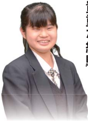
敬愛大学八日市場高校3年