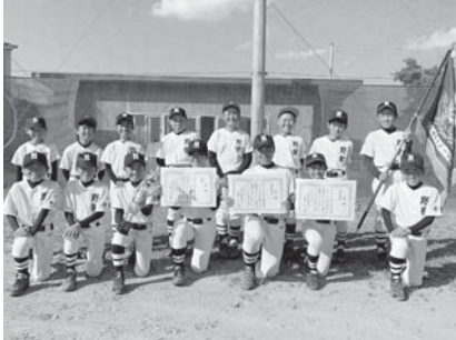
優勝した野栄スポーツ少年団

◆ 匝瑳市スポーツ少年団春季少年野球大会 （4月10日（土）・11日（日）、みどり平東公園野球場） 優勝…野栄スポーツ少年団 準優勝…匝瑳東ベースボールクラブ