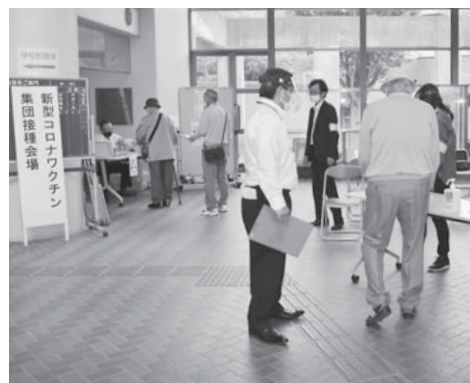
5月11日の集団接種では、高齢者約240人がワクチンを接種