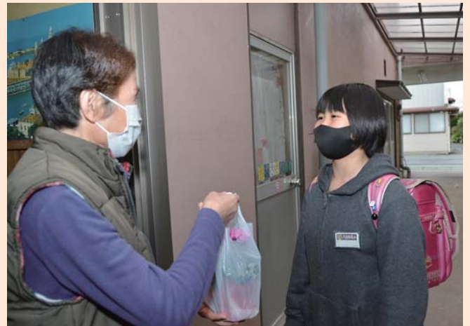
笑顔で花の苗とメッセージカードを手渡す児童