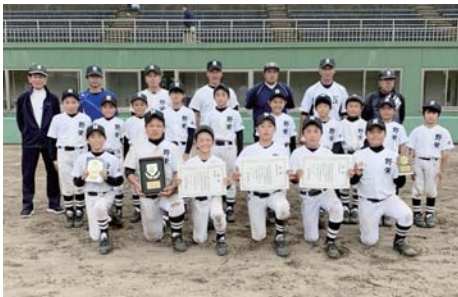
野栄スポーツ少年団