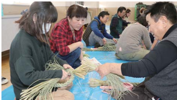
しめ縄づくり教室(昨年)