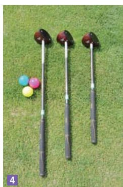
1 10月31日にオープンするパークゴルフそうさ 2 感謝状の贈呈を受ける施工業者 3 パークゴルフを体験する名称命名者 4 貸し出しするクラブ(左から大人用、ジュニア用、キッズ用)