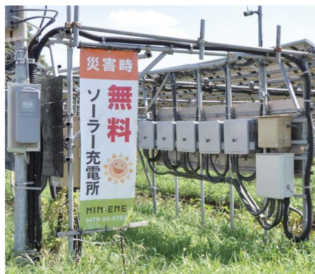
ソーラー発電設備による災害時の電力充電所