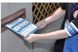
統計調査員が各世帯を訪問し、郵便受けなどに調査書類を配布します。