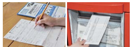
調査票に記入後、「郵送提出用封筒」に入れて郵便ポストへ投函してください。

●郵便ポストへの投函などが難しく、訪問回収を希望する場合は、調査員が訪問し調査票を回収します。希望者は、企画課（☎73-0081）までご連絡ください。