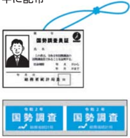
▲調査員が身に着ける「調査員証（見本）」（上）と「腕章（見本）」

大防止のため、原則として、訪問時に居住者への声掛けは行いません。会話が必要な場合は、マスク着用、インターネット越しに対応するなどします。