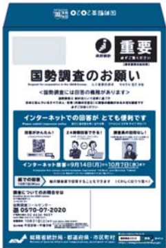
▲調査票は「調査書類封入封筒」により各世帯に9月中に配布

9月中に、調査員が各世帯を訪問し、「調査書類封入封筒」（青い封筒）を配布します。なお、調査員は調査員証（顔写真付き）と腕章を着用します。新型コロナウイルス感染症の拡