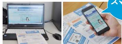
回答用サイトにログインして回答。回答時間の目安は、1人暮らし世帯の場合で約10分です。