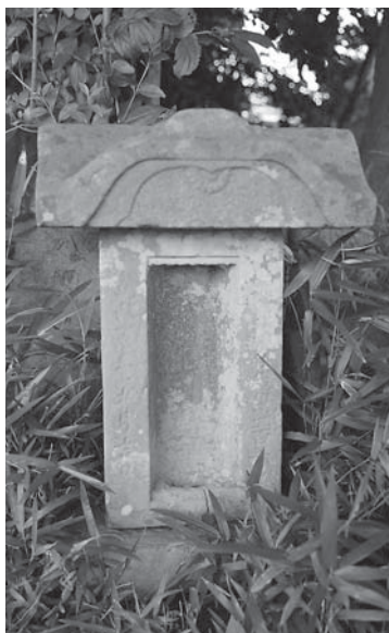
八坂神社の牛頭天王宮(飯高地区小高)

小高の八坂神社は毎年1月の裸参りて知られ、昭和40年代初めごろまで行事の前に祭囃子と山車が集落を回っていたこと