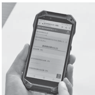
スマホから入力できる専用画面