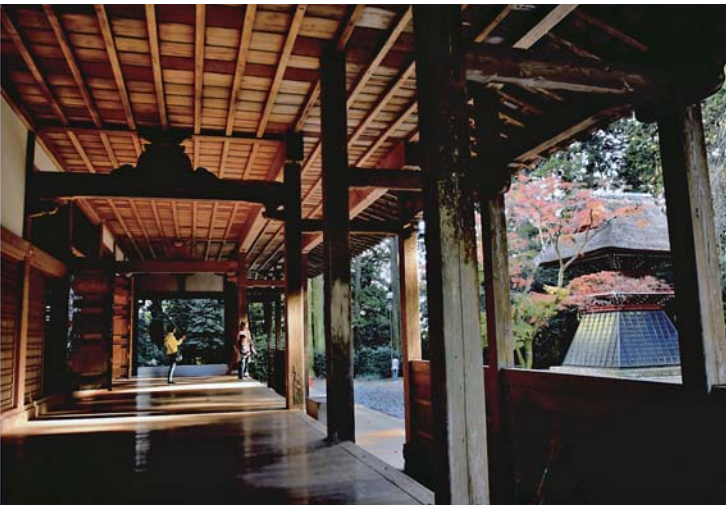
昨年度コンクール 金賞受賞作品