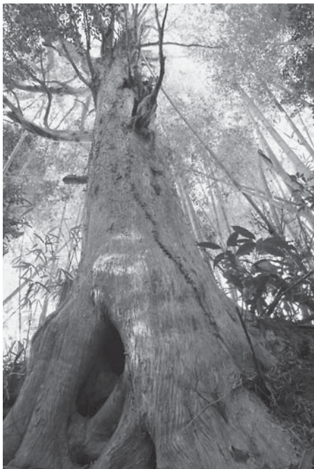
豊和地区(内山)の古木