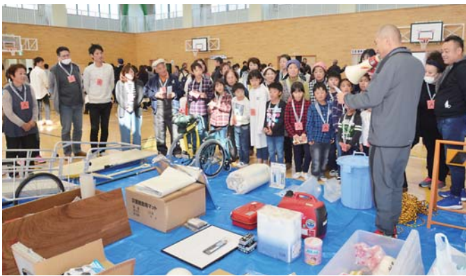
防災備品をクイズ形式で紹介