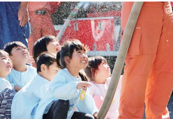
椿海保育園避難訓練(11月12日)