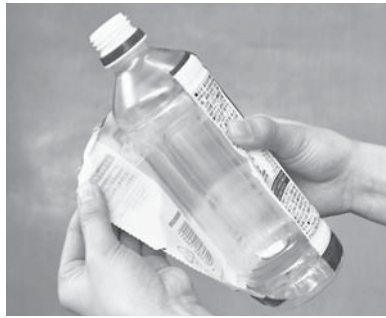
ペットボトルはキャップとラベルを外して分別排出

ペットボトルは、中を軽くすすぎ、キャップとラベルを外して資源ごみとして出してください。外したキャップとラベルは、資源ごみのプラスチック容器類として出してください。