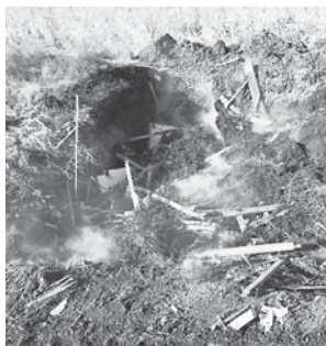
煙が立ち上り、火災になる手前だった野焼きの現場

野焼きは、煙や悪臭に加え、有害物質であるダイオキシン類の発生原因となるため、法律で禁止されています。火災の原因にもなるため、家庭ごみは焼却せず、ごみステーションに出しましょう。