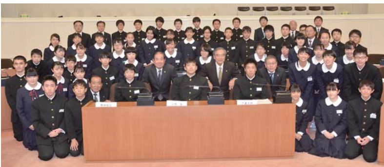
模擬議会終了後、市長、議長、副市長、教育長を囲み全員で記念撮影

年4回(3月・6月・9月・12月)開催される定例会や臨時会は、議場でどなたでも傍聴することができます。