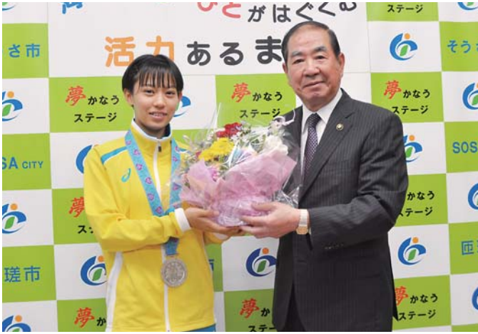
国体に出場し走り幅跳びで準優勝に輝いた白土さん(左)