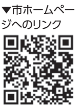
▼市ホームページへのリンク