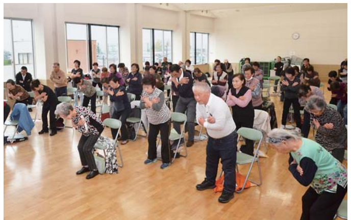
参加者全員で百歳体操を実施

百歳体操は、高齢者の寝たきり予防や身体機能の維持などを目的としたもので、本市では平成28年度からスタートし、現在では39団体が取り組んでいます。交流会には14団体・64人が参加し、理学療法士による解説に沿って、新たに2つの動きが加わった「いきいき百歳体操スペシャルバージョン」を1時間ほど掛けて行い、体操の効果をさらに高めるポイントを学びました。