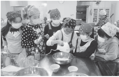
友だち同士で楽しくお菓子作り 「クリスマス&バレンタインスイーツ教室」