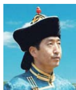
オットホンバイラ