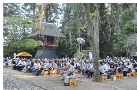
観客席を埋め尽くす人出で毎年好評のコンサート

※乗車定員を超える場合は第3便を運行予定です。なお、帰りのバス時刻は会場で案内します。※バス利用者向けの駐車場のご用意はありません。民間駐車場をご利用ください。