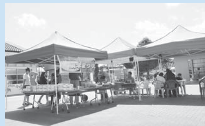
おいしい新米をその場で提供

9月14日(土)・15日(日)は、新米の販売や、おいしい炊き立て新米の試食会を行います。ぜひご来店ください。時間は9時～16時です。