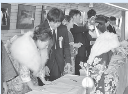
受け付けで旧友と再会