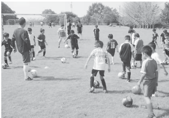
サッカー教室の様子