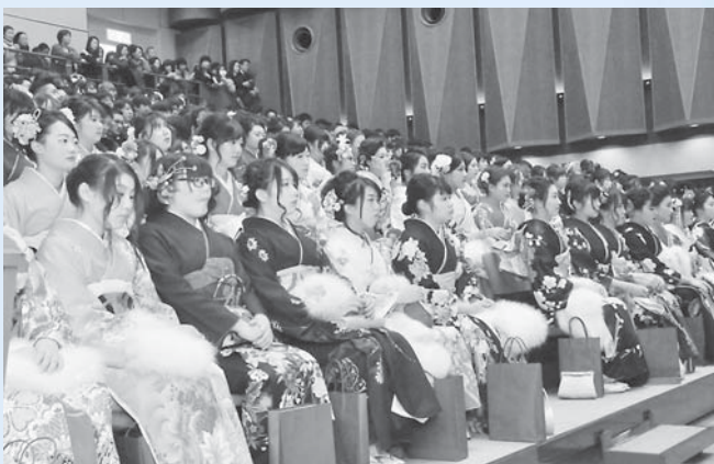
厳かに行われる式典の様子