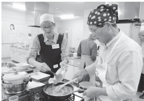
オトコの料理道場教室（昨年）