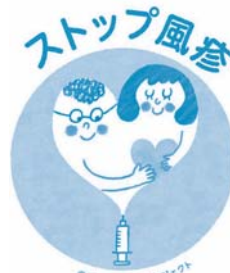
※NHKオンラインより転載

※37年4月2日から47年4月1日まで生まれの人は、来年度にクーポン券を発送します。今年度中に抗体検査や予防接種を希望する場合は、クーポン券を発行しますので左記までご連絡ください。