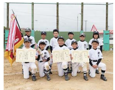
市少年野球低学年大会で優勝した野栄スポーツ少年団