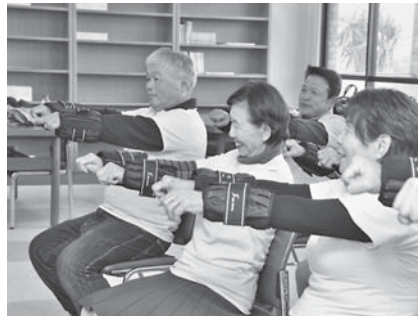
手足に調節可能な重りを巻き付けて行う「百歳体操」