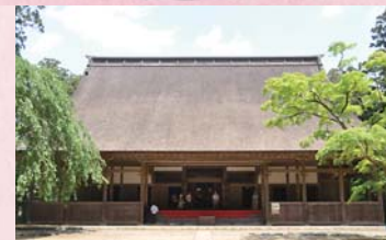
飯高寺講堂(写真上)と講堂裏のボタン