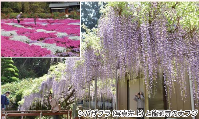
シバザクラ(写真左上)と龍頭寺の大フジ