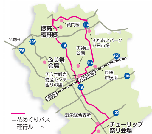
＝花めぐりバス運行ルート