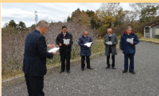
産業建設常任委員会の行政視察