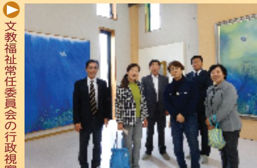
文教福祉常任委員会の行政視察