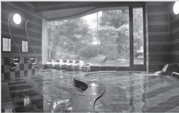
広々とした浴室（写真は男性浴室）。洗い場は男女ともに6か所設置