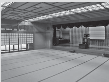
教養娯楽室では入浴後に囲碁や将棋などを楽しめる