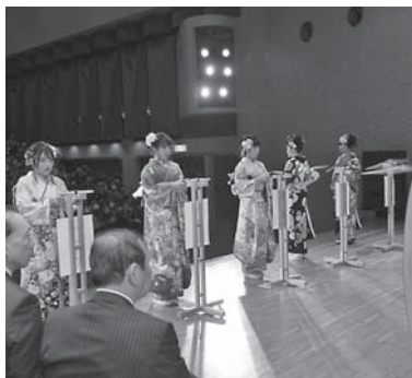
新成人が晴れ着姿で抽選を実施