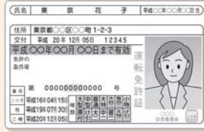
身元確認ができるもの

通知カードなどマイナンバーが記載されたものと、運転免許証や公的医療保険の被保険者証など本人確認ができるものが必要です。